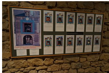
les douze phases,