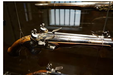
Pistolet double Cassan-Nautre

La salle des armes, au premier étage, présente de nombreuses armes issues de la manufacture d'armes de Charleville. La pharmacie de l'hôpital de 1756 présente ses 120 pots de faïences au public. Le musée présente également une grande collection de 3000 pièces de monnaie des principautés d'Arches, Château-Régnault, Bouillon.