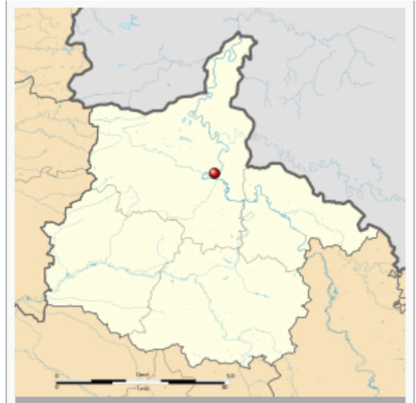
Géolocalisation sur la carte : France

Au rez-de-chaussée, se trouve présenté des objets gaulois, gallo-romain, mérovingiens, médiévaux trouvés lors de fouilles dans les Ardennes.