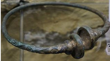
Torque à gros tampons.