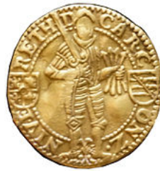
Ducat d'or de Charleville.