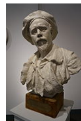
buste de Eugène Damas par Alphonse Colle.