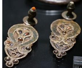
Appliques, Sémidé du 4 e siècle av. J.-C.