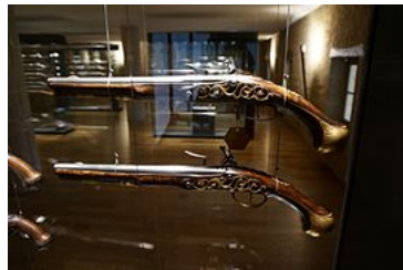
Pistolet d'arçon Champeau.