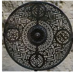
Phalère aux svastikas, Bourcq, tombe à char du 5 e siècle av. J.-C.