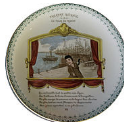
assiette VIII théâtre Guignol le tour du monde .