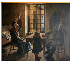
En grève par Paul Gondrexon.

L'histoire et la vie quotidienne du département est présentée à travers différentes expositions de toiles comme celles du peintre Eugène Damas ou encore d'objets de la vie quotidienne. Au deuxième étage.