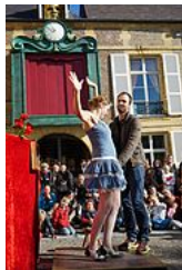
Vue de l'horloge sur la place,