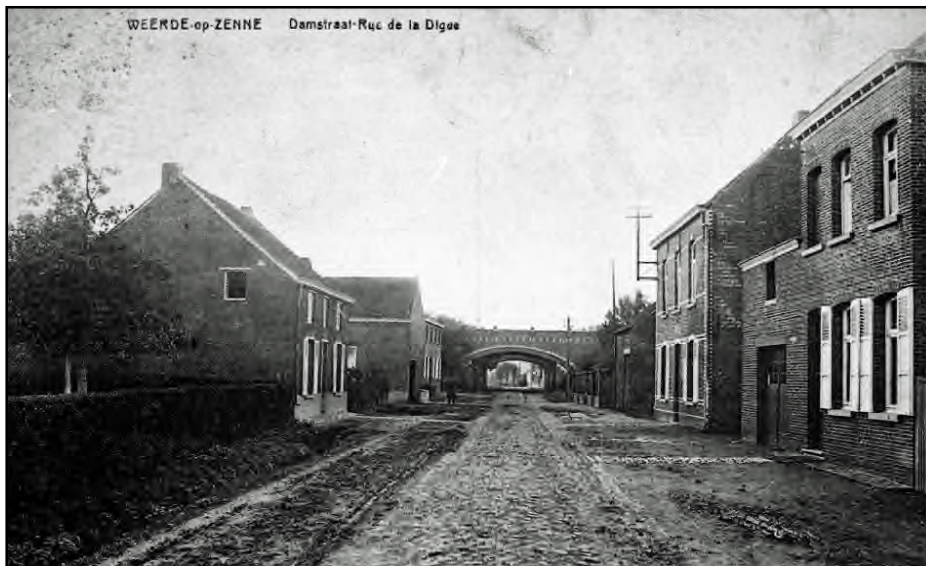
Foto genomen omstreeks 1930 van de Damstraat te Weerde toen nog Weerde-op-Zenne genoemd.

Wanneer men onder de spoorwegbrug kijkt bemerkt men in de verte het kapelletje van Onze-Lieve-Vrouw. Het stond op de hoek van de Damstraat en de Heidestraat. Er stonden drie in boogvorm aangeplante en gesnoeide bomen die als het ware een haag vormden. In het midden van de haag stond het beeldje.